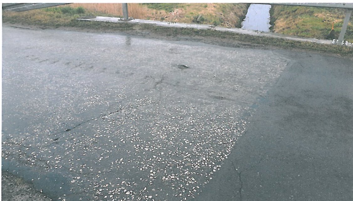
Fot. 2. Zniszczenie struktury nawierzchni bitumicznej na obiekcie oraz spękania nawierzchni świadczące o starzeniu się masy.