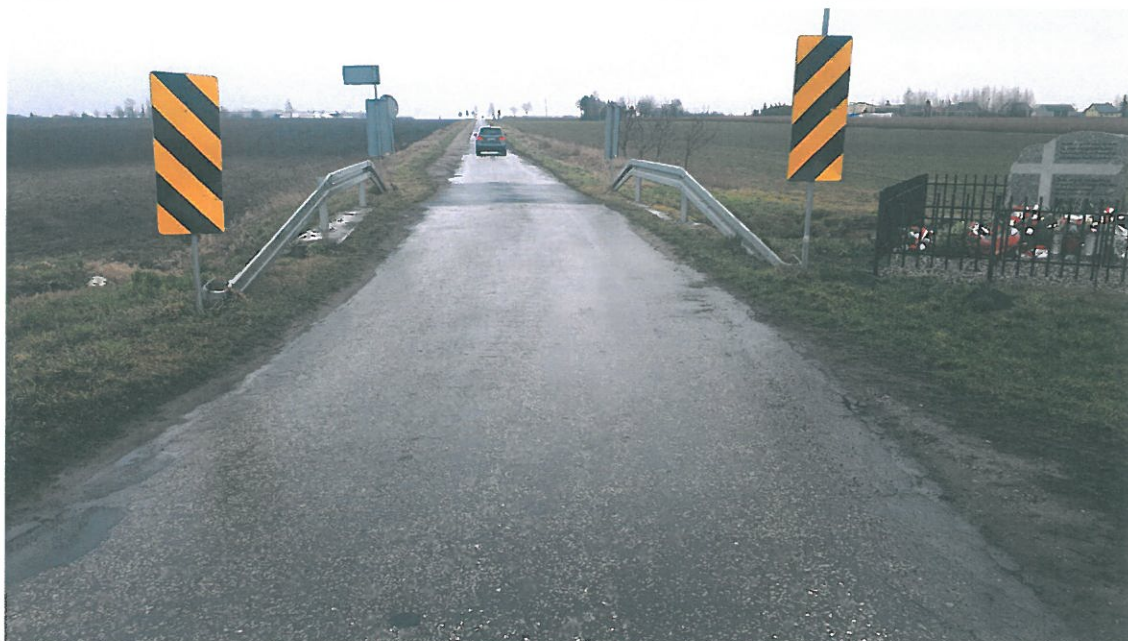
Fot. 3. Widok na dojazd na obiekt.