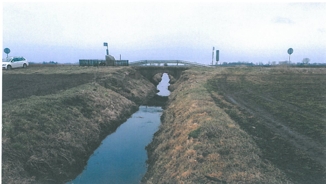
Fot. 1. Widok z boku na obiekt.