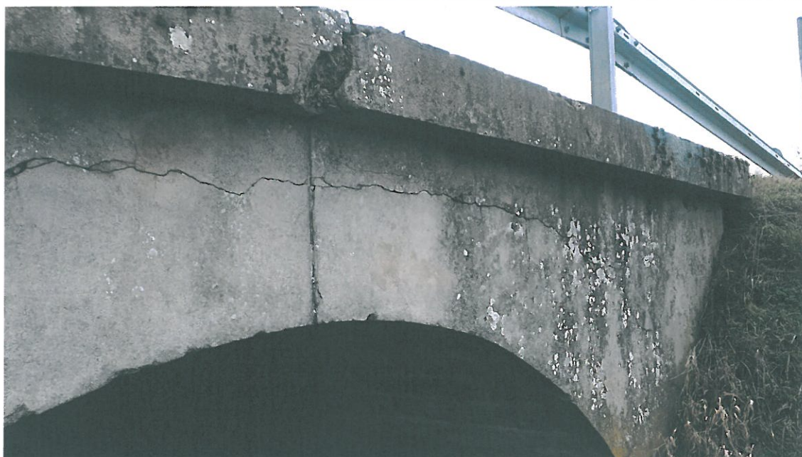
Fot. 4. Korozja, starzenie się, wegetacja roślinności na betonie ustroju, przyczółka i gzymsów. Pęknięcie na styku sklepienia ze ścianami przyczółka.