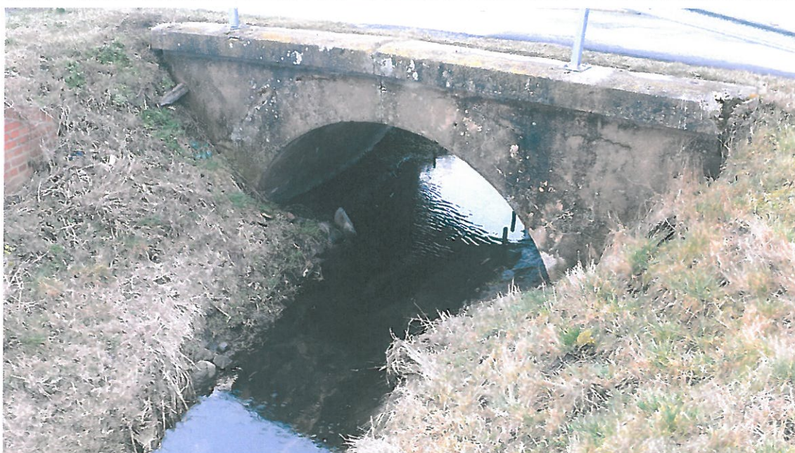
Fot. 10. Widok na przestrzeń okołomostową.