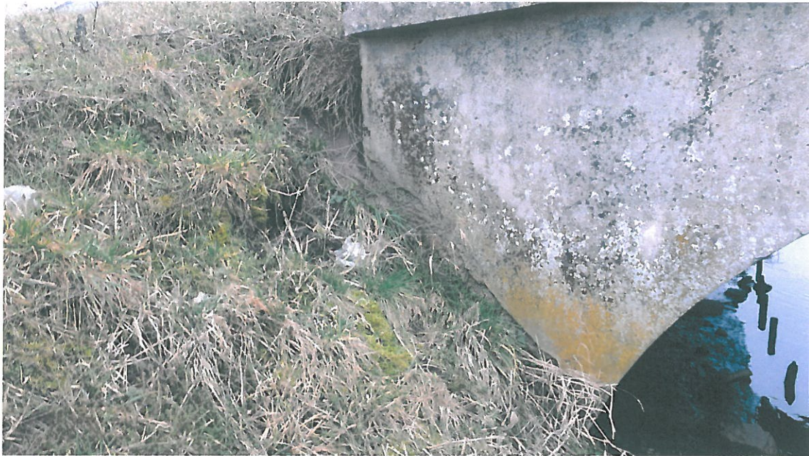
Fot. 7. Ubytki skarpy przyczółkowej.