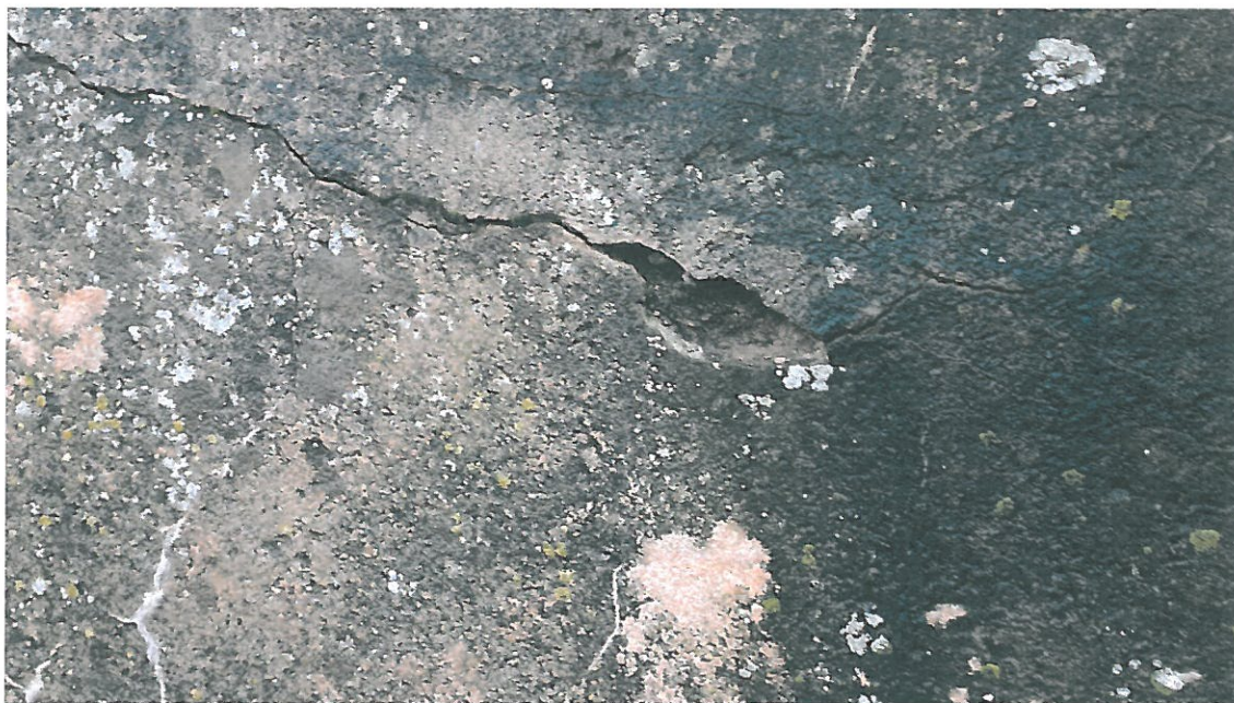
Fot. 6. Zniszczenie zabezpieczenia antykorozyjnego betonu przyczółka, widoczny słaby beton o niskiej zawartości cementu.