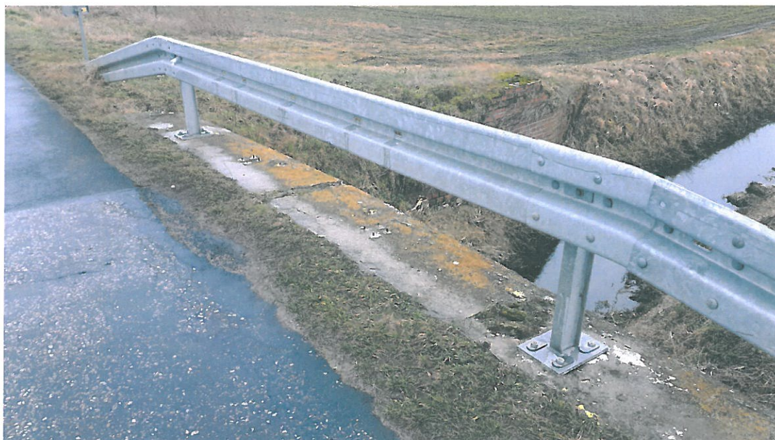
Fot. 1. Brak balustrad bądź barier uzupełnionych dodatkową poręczą oraz elementami poziomymi. Obiekt nie spełnia warunków Dz.U. 2000 nr 63 poz.735 rozdział 9, §180 pkt 8 oraz §251 ust 1,3.