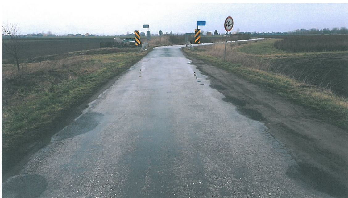
Fot. 4. Widok na dojazd do obiektu od strony m.Radłówek.