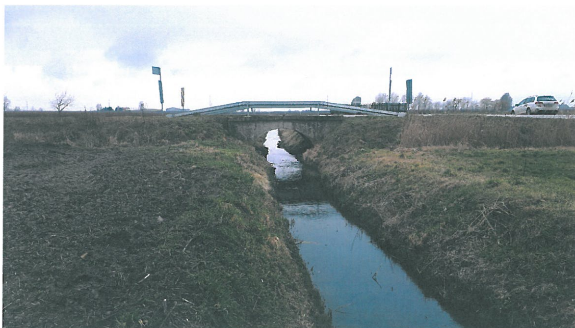
Fot. 2. Widok z boku na obiekt.