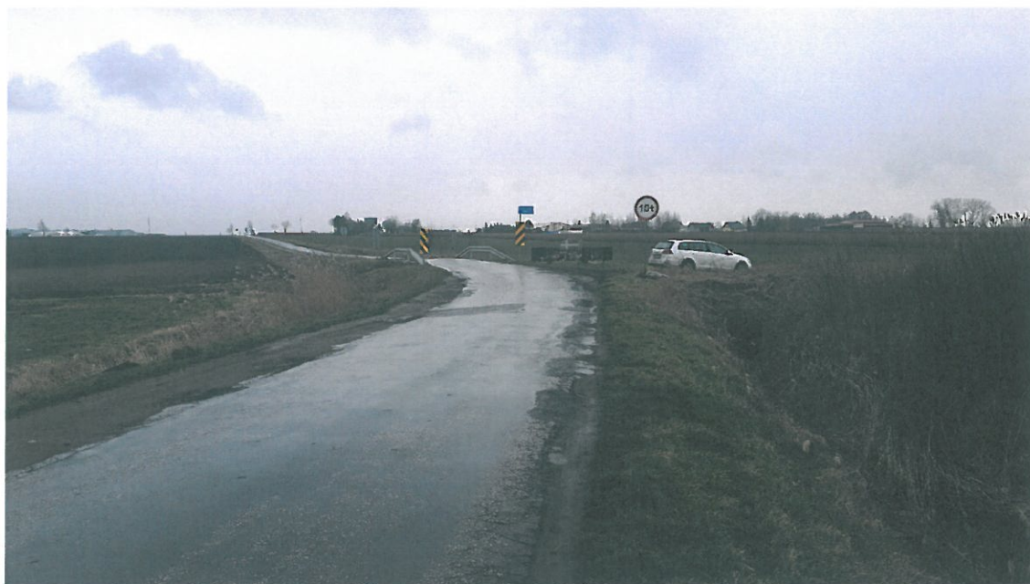
Fot. 3. Widok na dojazd do obiektu od strony m.Rycerzewko.