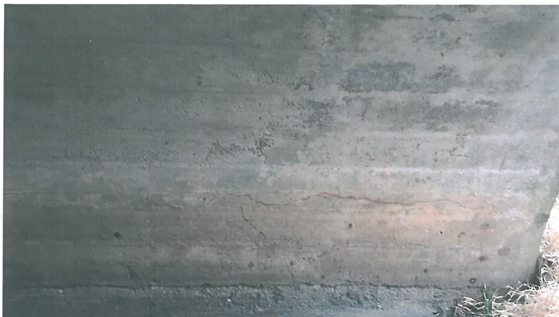
Fot. 9. Wyplukane spoiwo w betonie o niskiej zawartości cementu w strefie pływów wody.