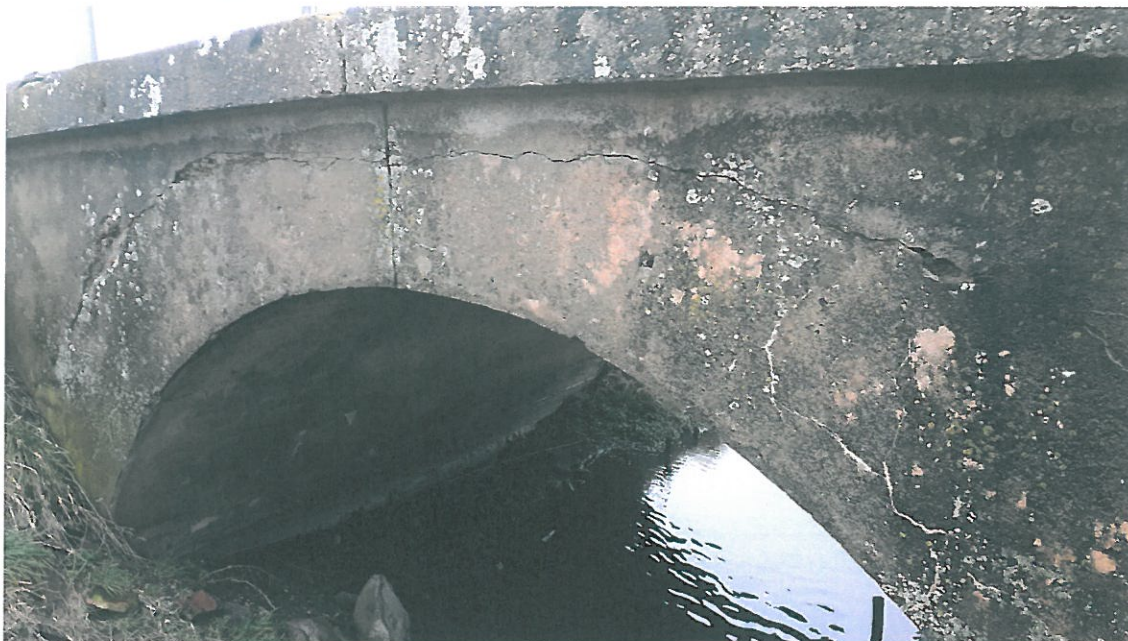
Fot. 5. Wykwity, ubytki, korozja, starzenie się betonów przyczółka. Zniszczenie powłok antykorozyjnych betonu.